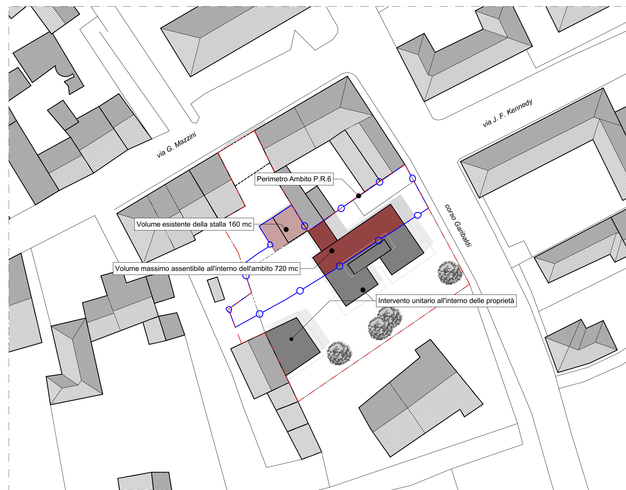
Pianta delle coperture _ Sc. 1:500